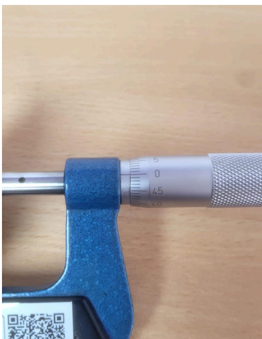
Figura 2. Punto cero corregido.