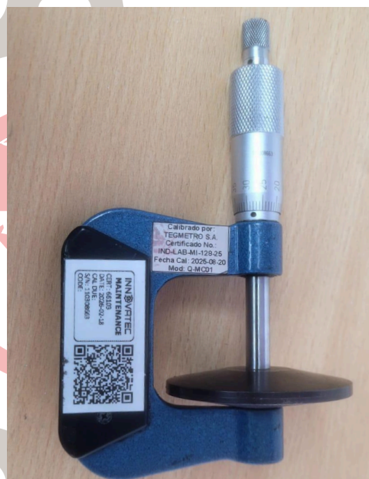
Figura 3. Limpieza del equipo.