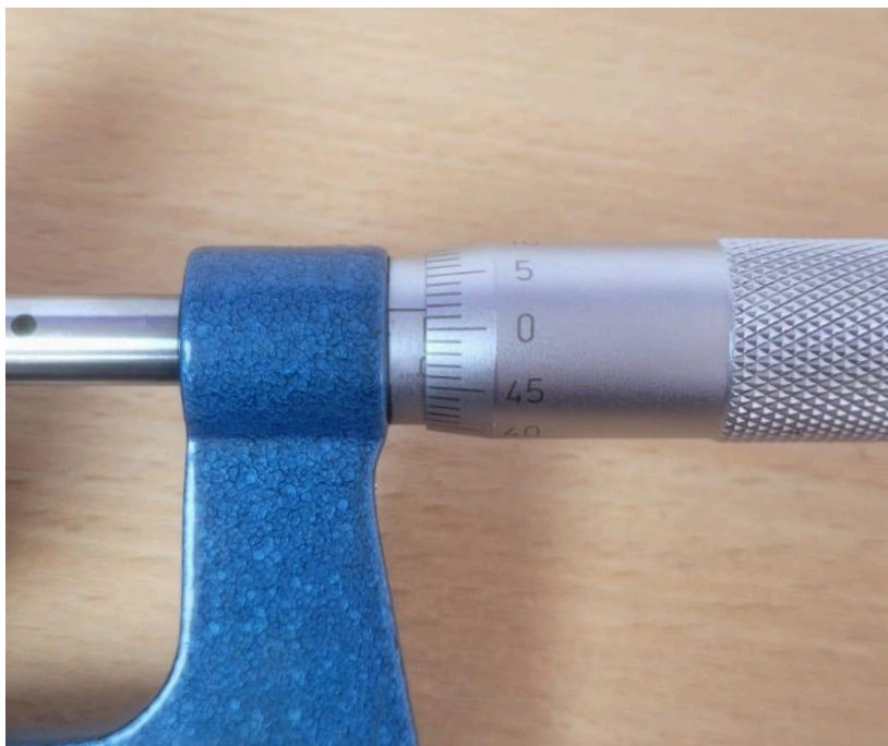
Figura 1. Punto cero encontrado.