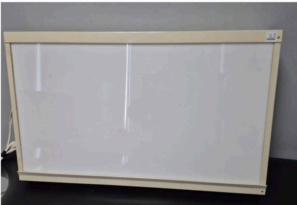
Figura 1. Vista frontal del equipo.