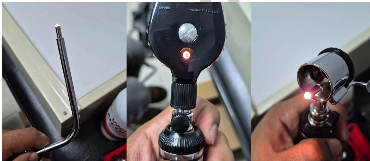
Figura 2. Funcionamiento del equipo.