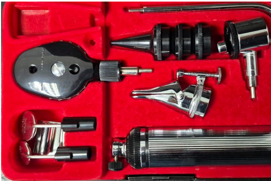
Figura 1. Vista frontal del equipo.