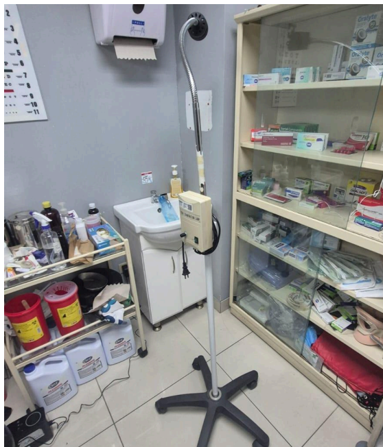
Figura 1. Vista frontal del equipo.