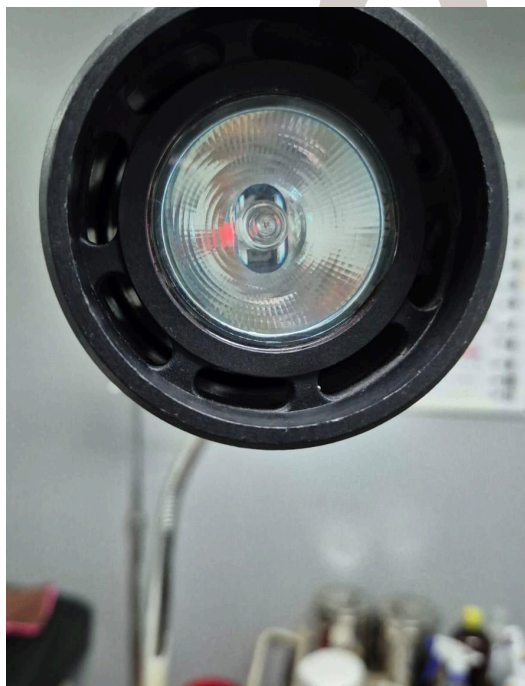
Figura 2. Led de la lámpara.