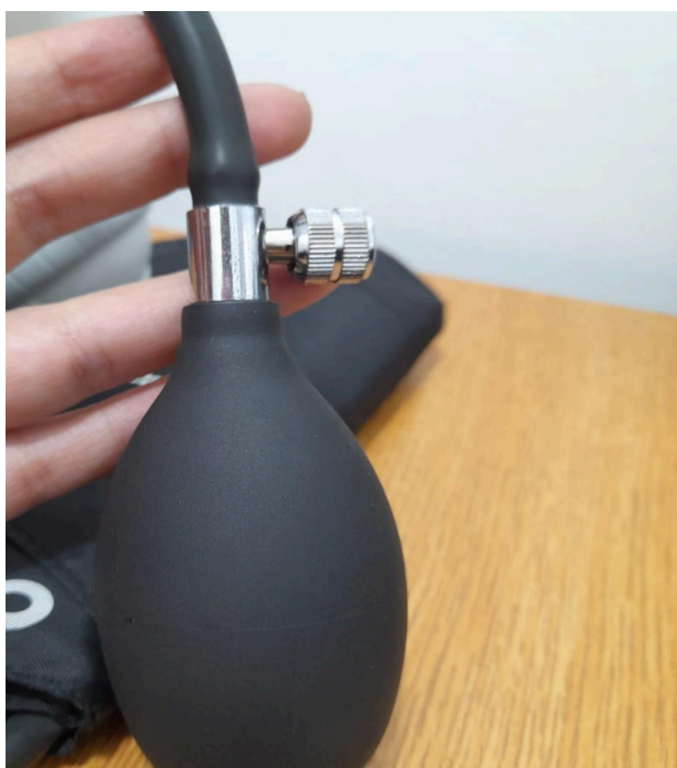
Figura 2. Partes del equipo en buen estado.