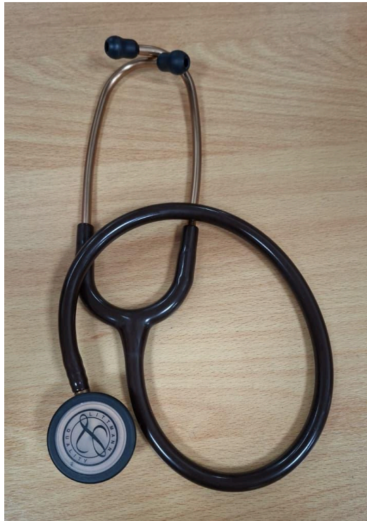
Figura 1. Vista general del equipo