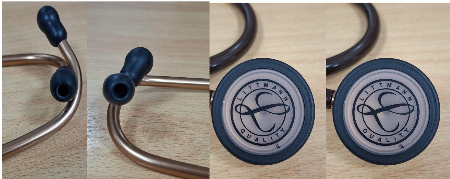
Figura 2. Residuos biológicos antes de mantenimiento