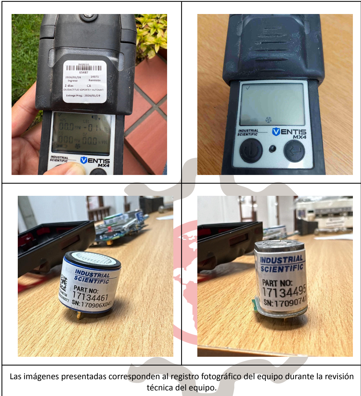
Las imágenes presentadas corresponden al registro fotográfico del equipo durante la revisión técnica del equipo.