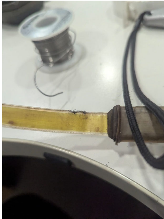
Fig 5. Soldadura realizada, Funcion momentane hasta que se realiza movimiento en la cinta, sugiriendo otro u otros puntos de ruptura.