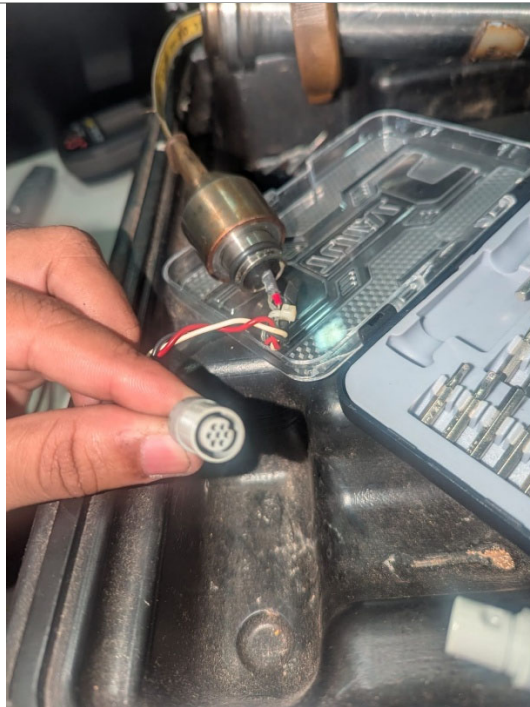
Fig 3. Conector del sensor en buen estado