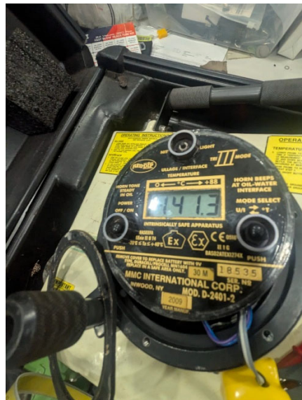
Fig. 6 Falla persistente en el equipo.