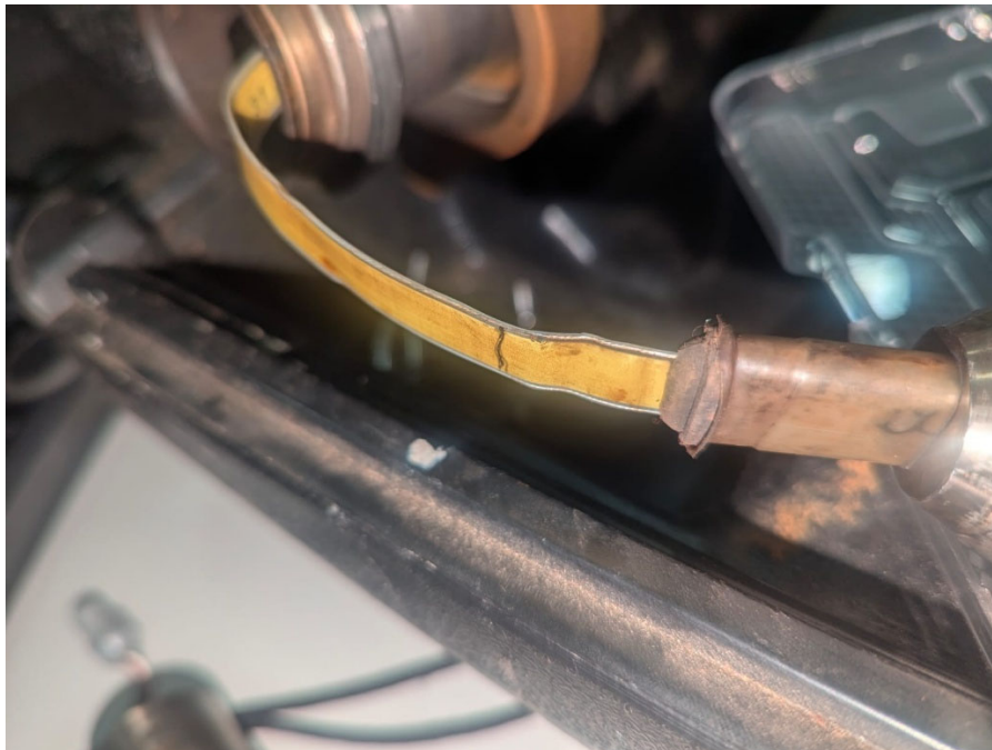
Fig 4. Punto de interrupción de señal, cable suelto