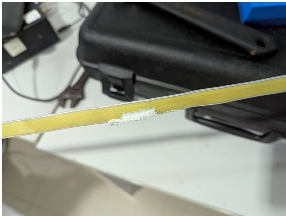
Fig 2. Reparación del punto afectado, se colocó silicon para evitar que se rompa, pero esa capa de silicón podria fallar en un entorno donde hayan combustibles o químicos fuertes.