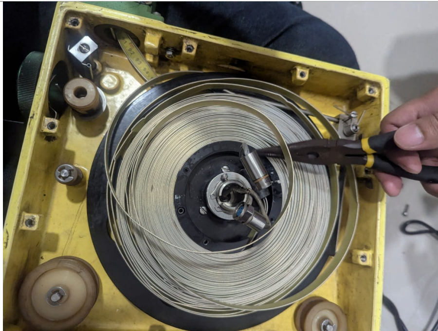
Fig 1 Cinta fuera de los rodillos guía, llegó a trabarse en el mecanismo causando fallas en el desplazamiento de la cinta