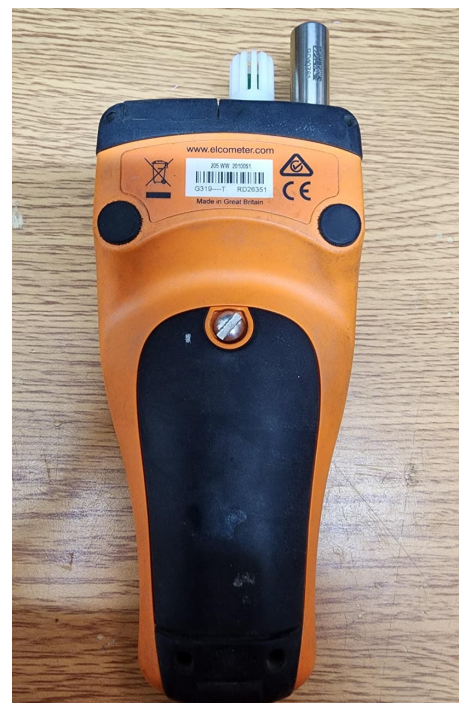
Imagen frontal y posterior del equipo.