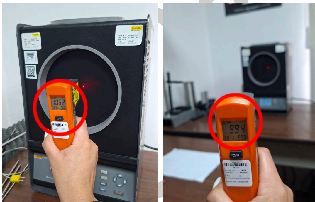
Figura 2. Error sobre el E.M.P en 120°C .