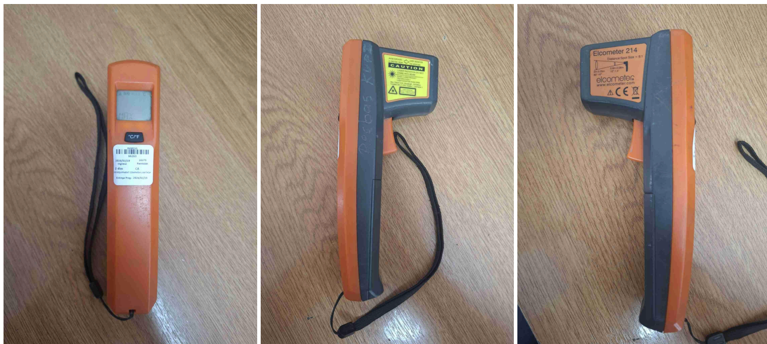
Figura 1. Vista frontal del equipo.