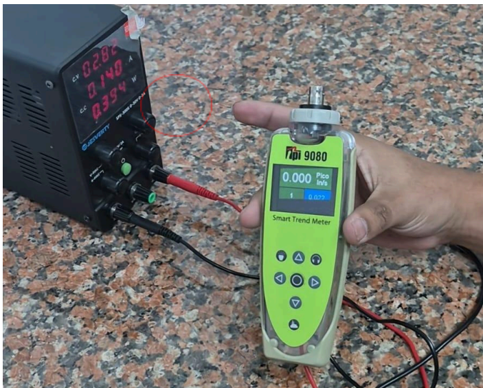
Figura 3: Encendido del equipo.