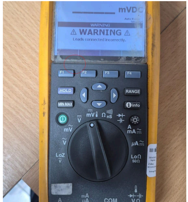
Figura 2: Mensaje del equipo.