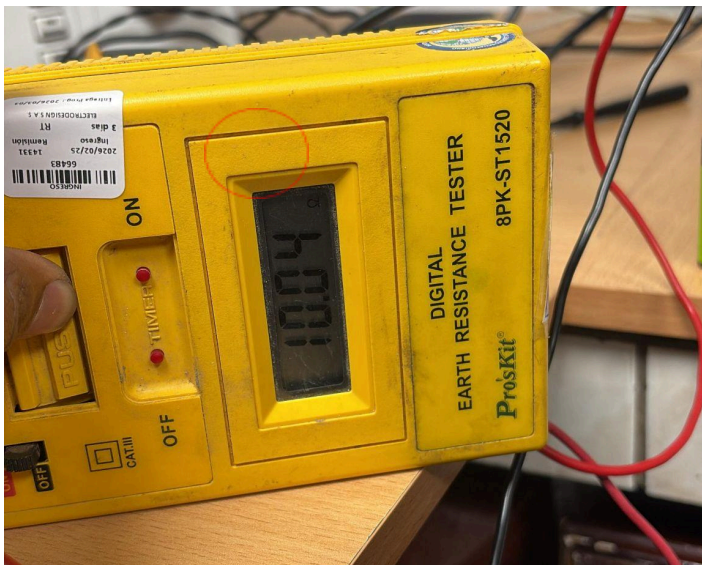
Figura 3: Medición del equipo.