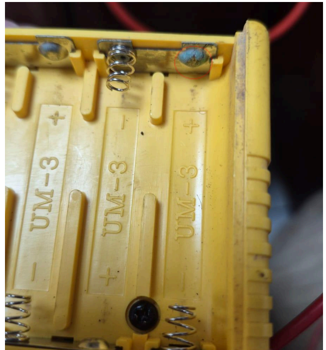
Figura 2: Bornes de las baterías.