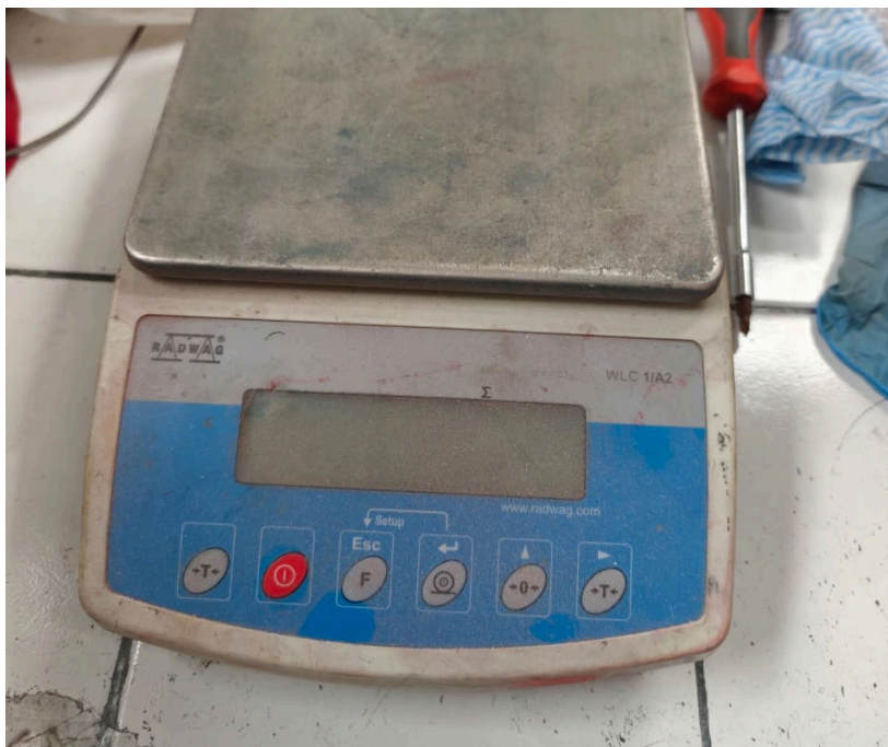
Figura 1. Vista frontal del equipo.