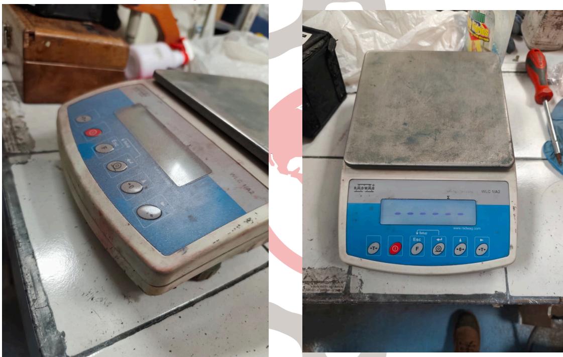
Figura 2. Vista General del Equipo