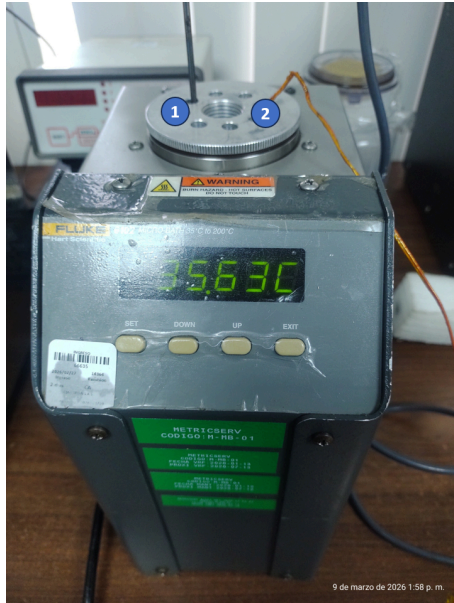
Diagram de Posición de Sensores (Sensor Position Diagram)