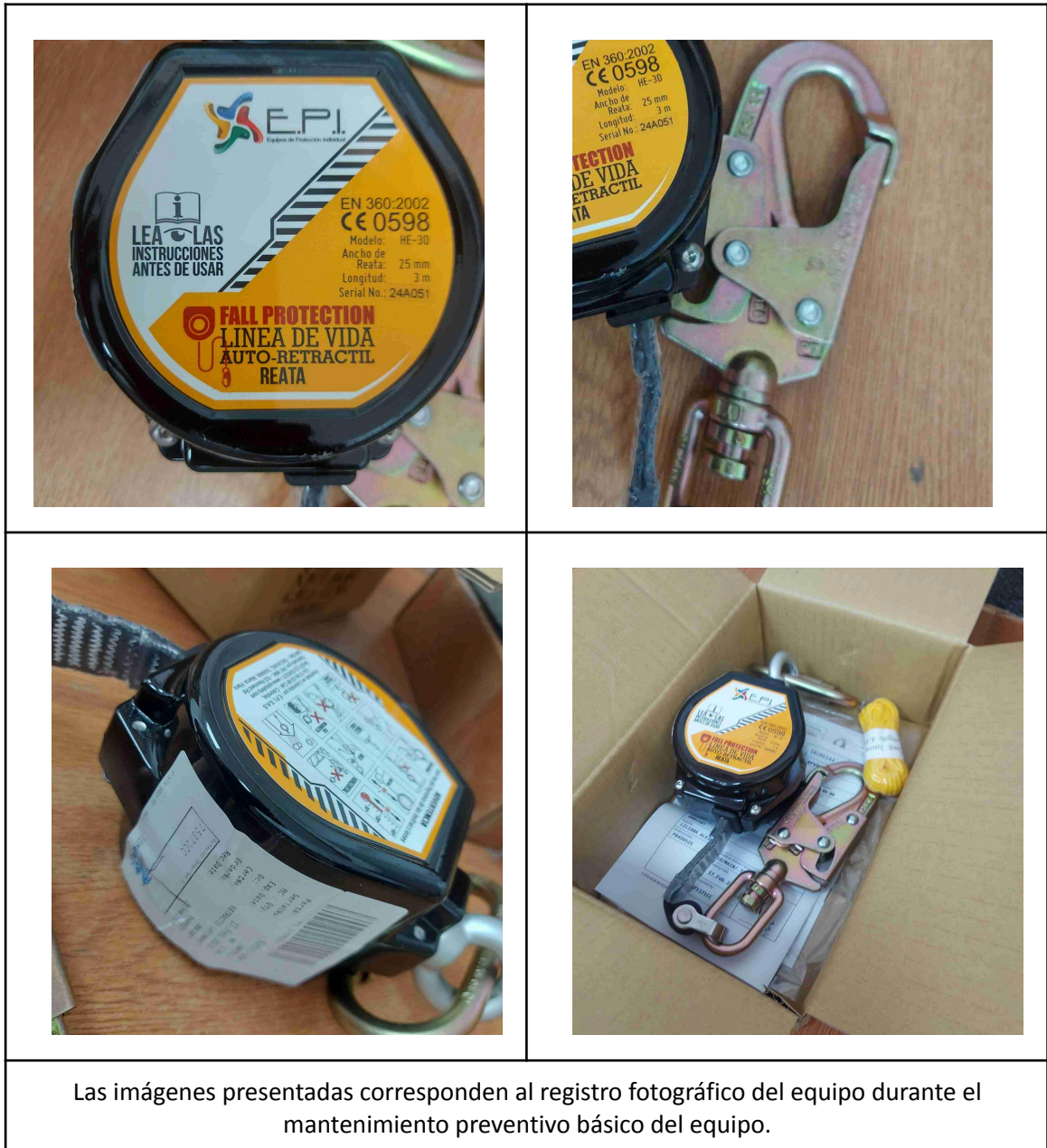
Las imágenes presentadas corresponden al registro fotográfico del equipo durante el mantenimiento preventivo básico del equipo.