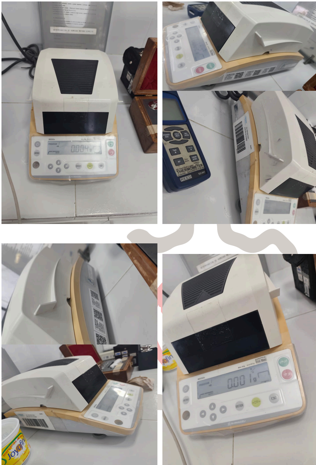
Figura 1: Estado óptimo del equipo en temperatura y masa