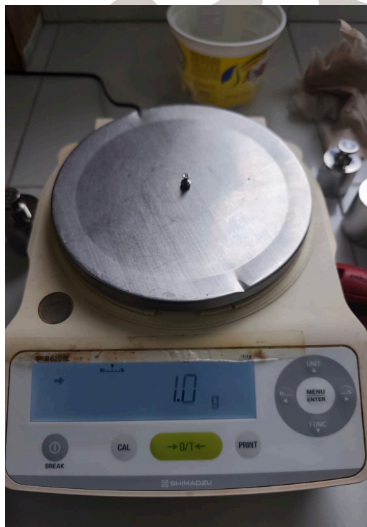
Figura 1: Estado óptimo del equipo en temperatura y masa