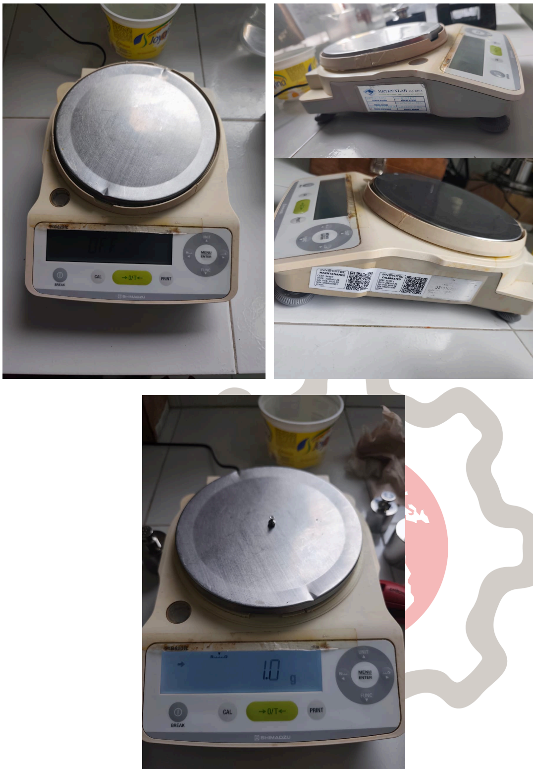
Figura 1: Estado óptimo del equipo en temperatura y masa