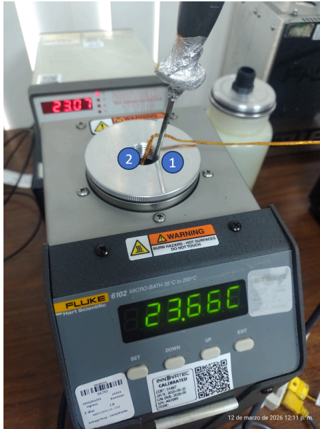
Diagram de Posición de Sensores (Sensor Position Diagram)