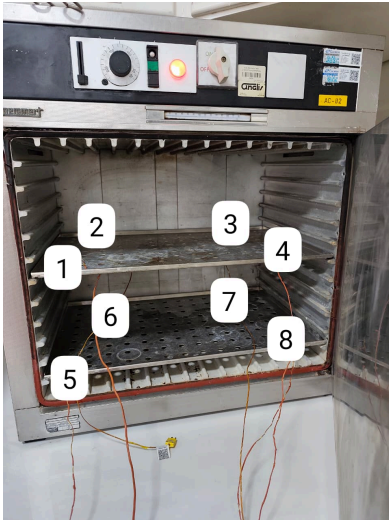
Diagram de Posición de Sensores (Sensor Position Diagram)