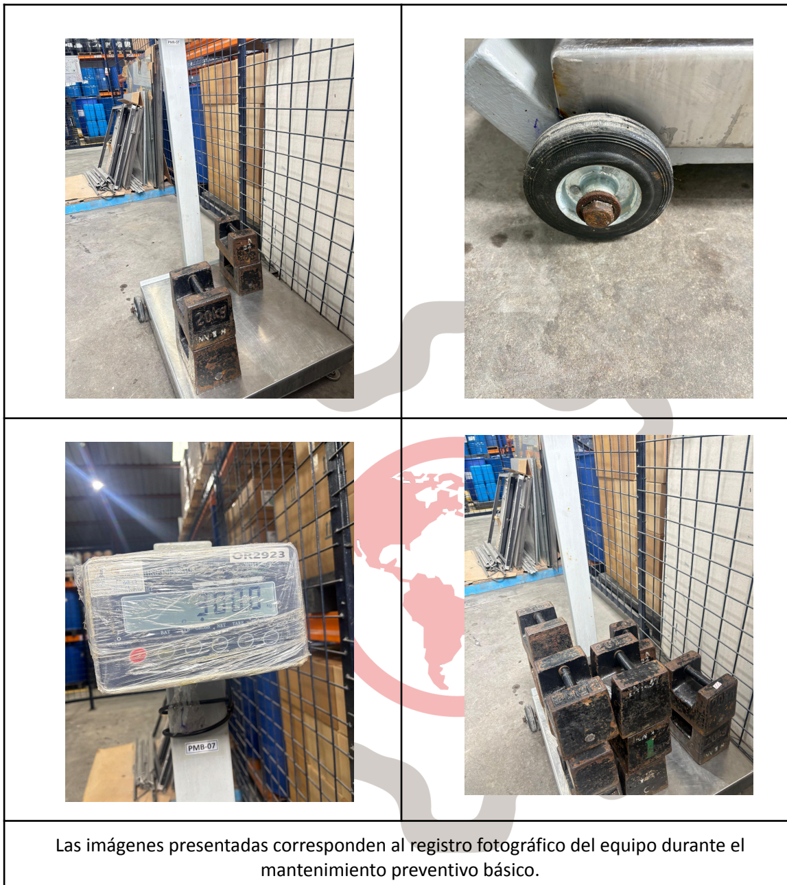
Las imágenes presentadas corresponden al registro fotográfico del equipo durante el mantenimiento preventivo básico.