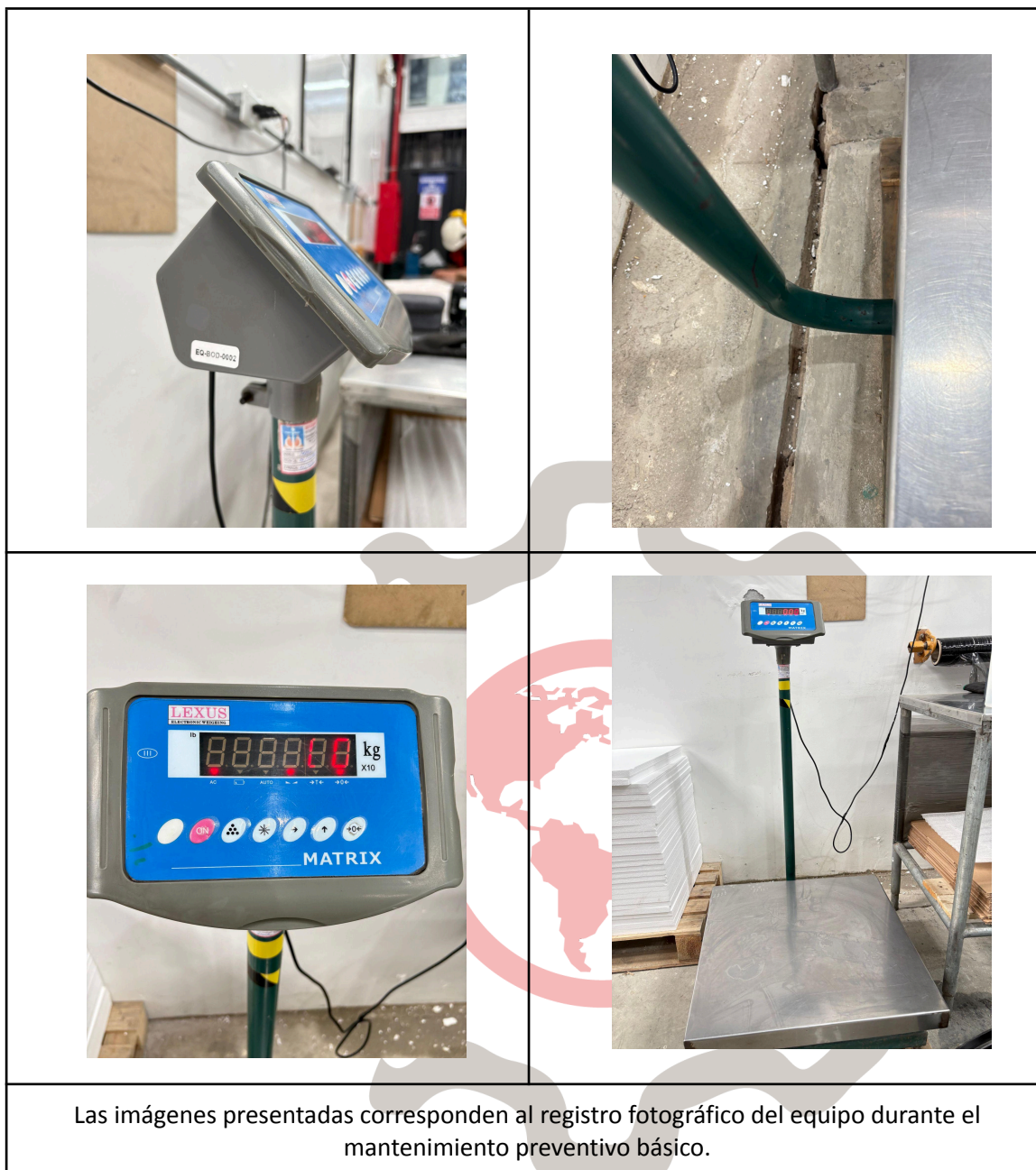
Las imágenes presentadas corresponden al registro fotográfico del equipo durante el mantenimiento preventivo básico.