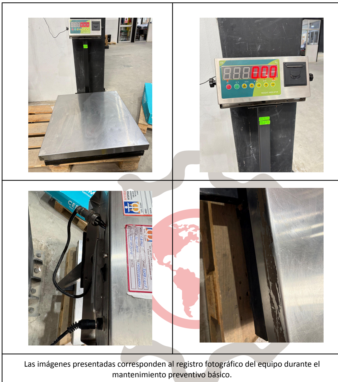
Las imágenes presentadas corresponden al registro fotográfico del equipo durante el mantenimiento preventivo básico.