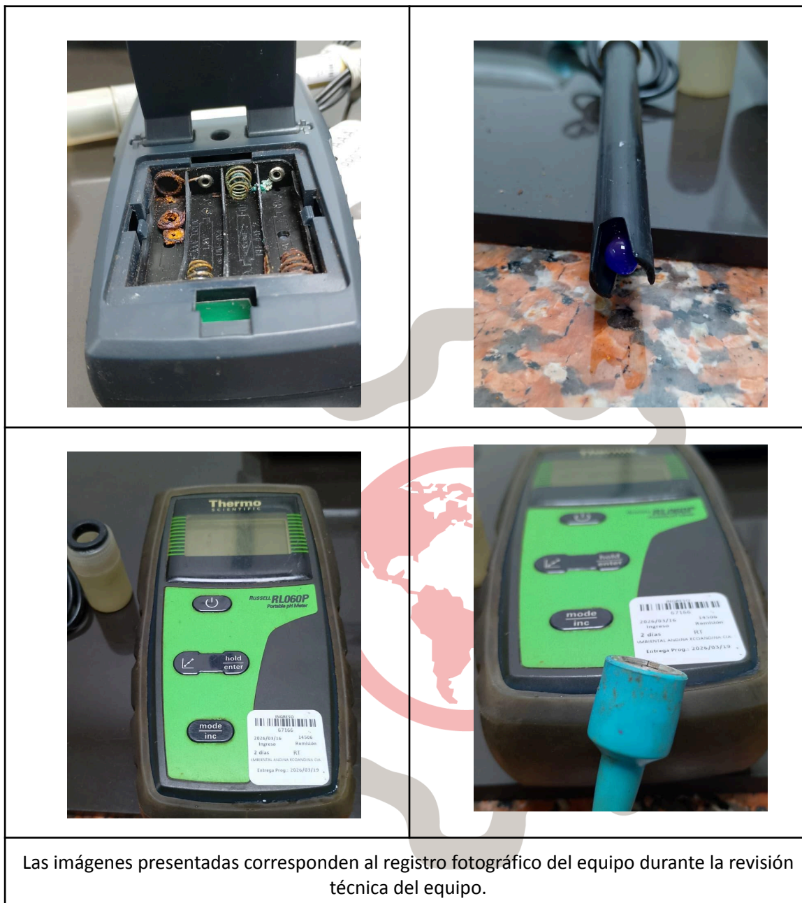
Las imágenes presentadas corresponden al registro fotográfico del equipo durante la revisión técnica del equipo.