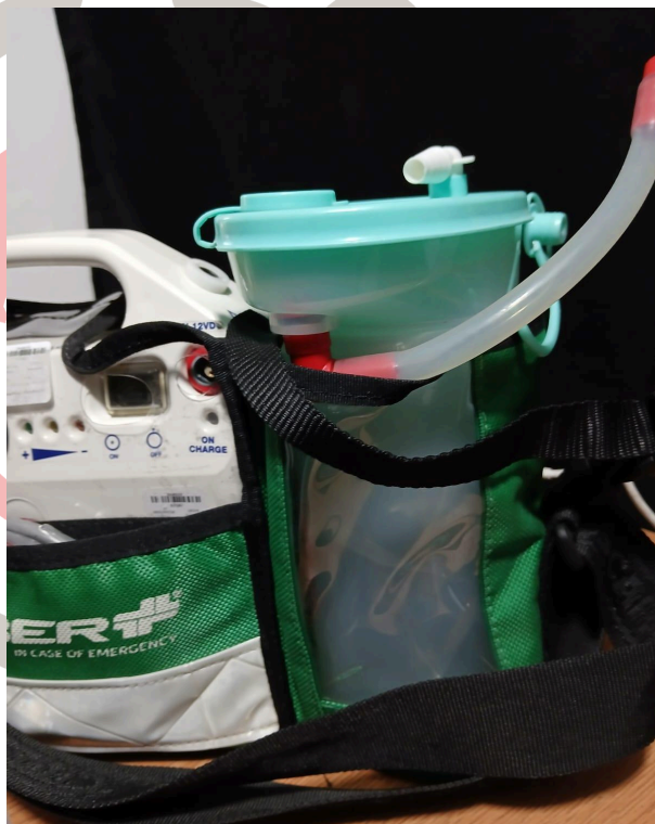
Verificación de funcionamiento