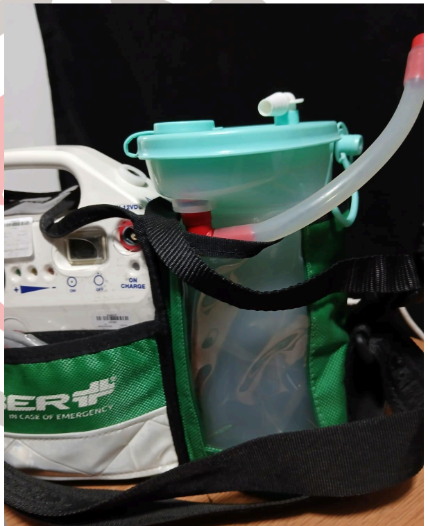
Verificación de funcionamiento