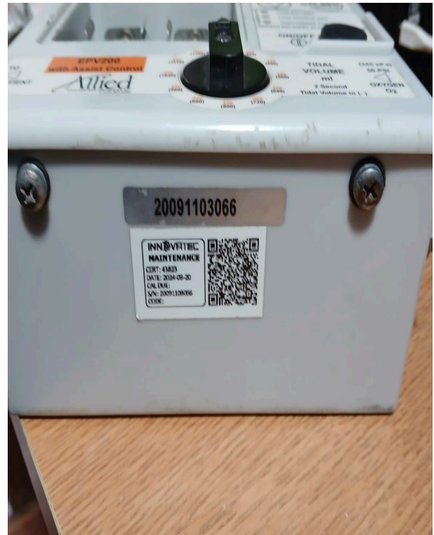
Vista General del Equipo.