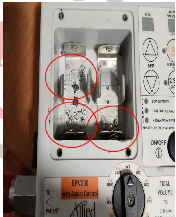
Óxido y sulfato en placa de contacto de baterías.