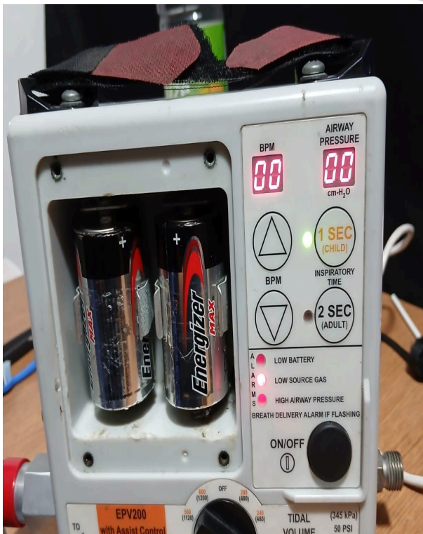
Placa de contacto de baterías antes de mantenimiento.