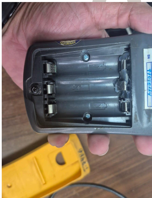
Figura 2. Sección arreglada.