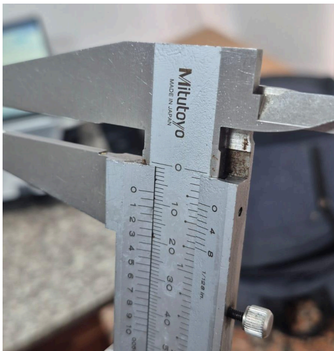
Figura 1. Sección oxidada.