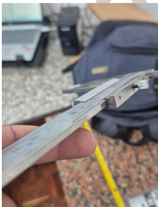
Figura 2. Sección oxidada.