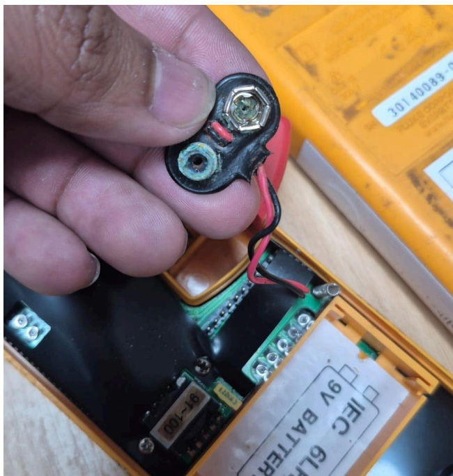
Figura 1. Sección dañada.