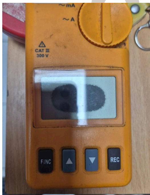
Figura 2. Pantalla dañada.