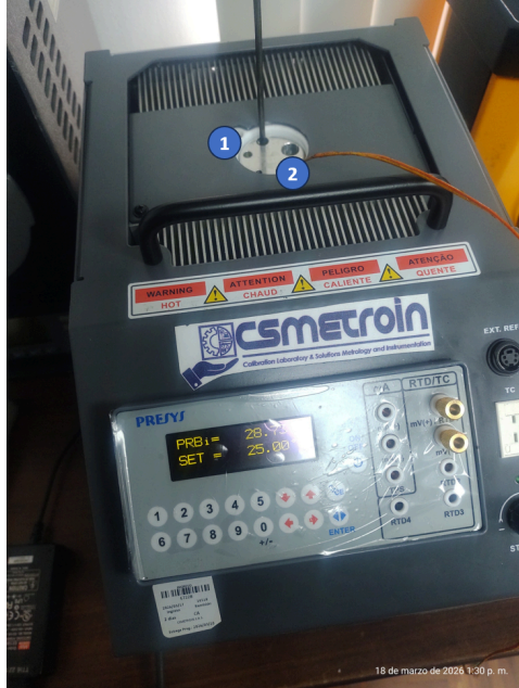
Diagram de Posición de Sensores (Sensor Position Diagram)