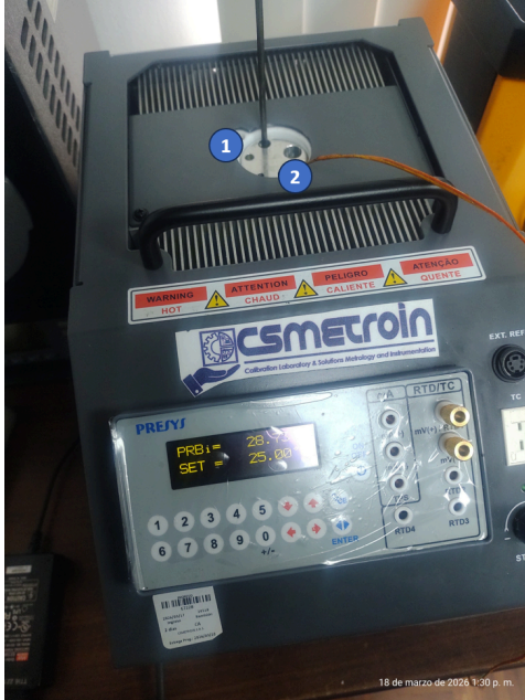
Diagram de Posición de Sensores (Sensor Position Diagram)