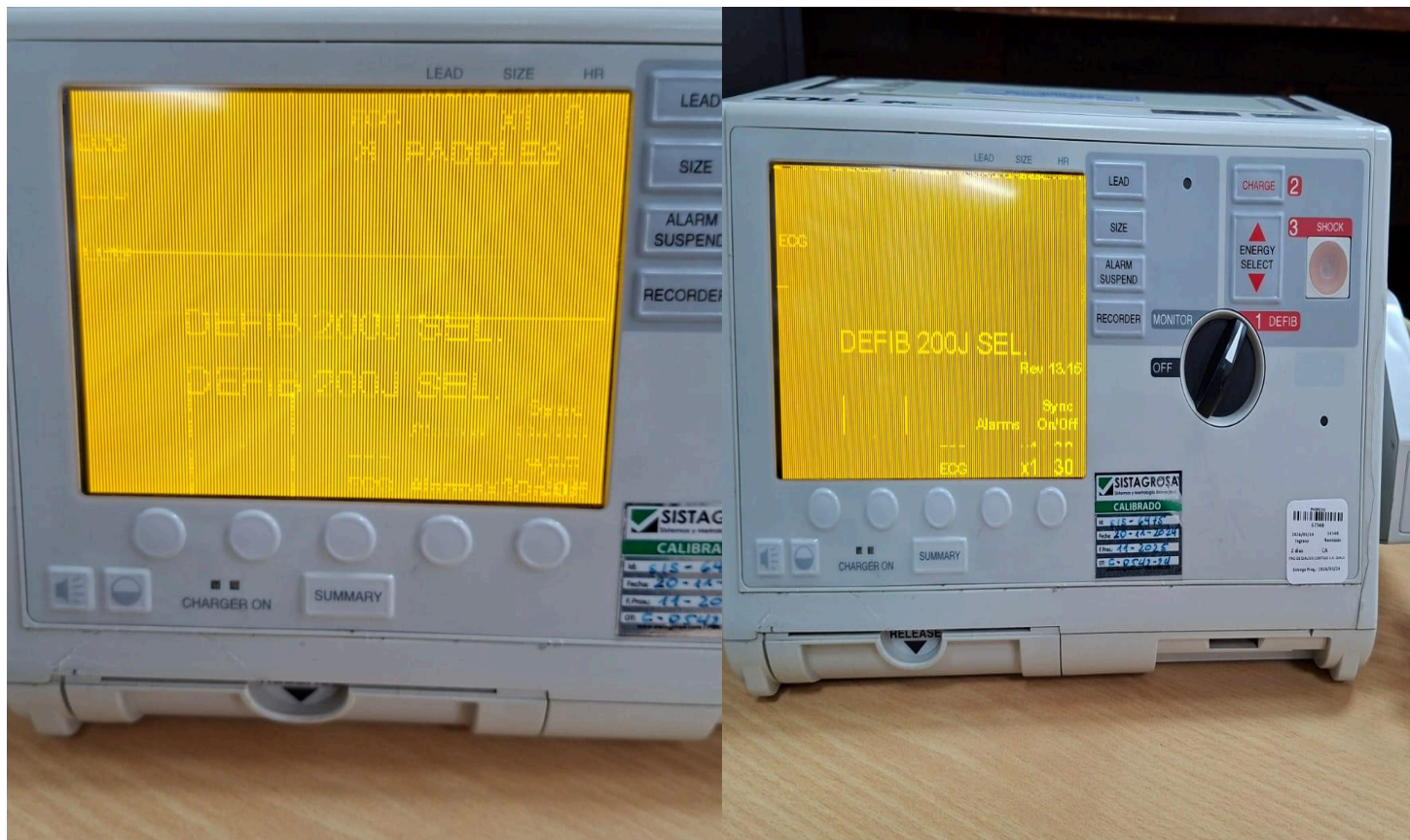
Figura 1. Condición inicial del equipo, donde se evidencia falla en la visualización de la pantalla, presentando distorsión y líneas que afectan la correcta lectura de la información.