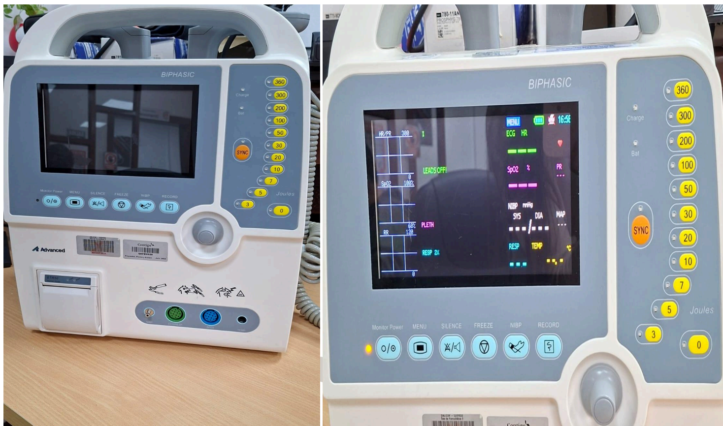
Figura 1. Vista general del equipo.