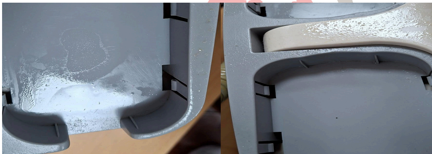
Figura 2. Presencia de aceite en equipo