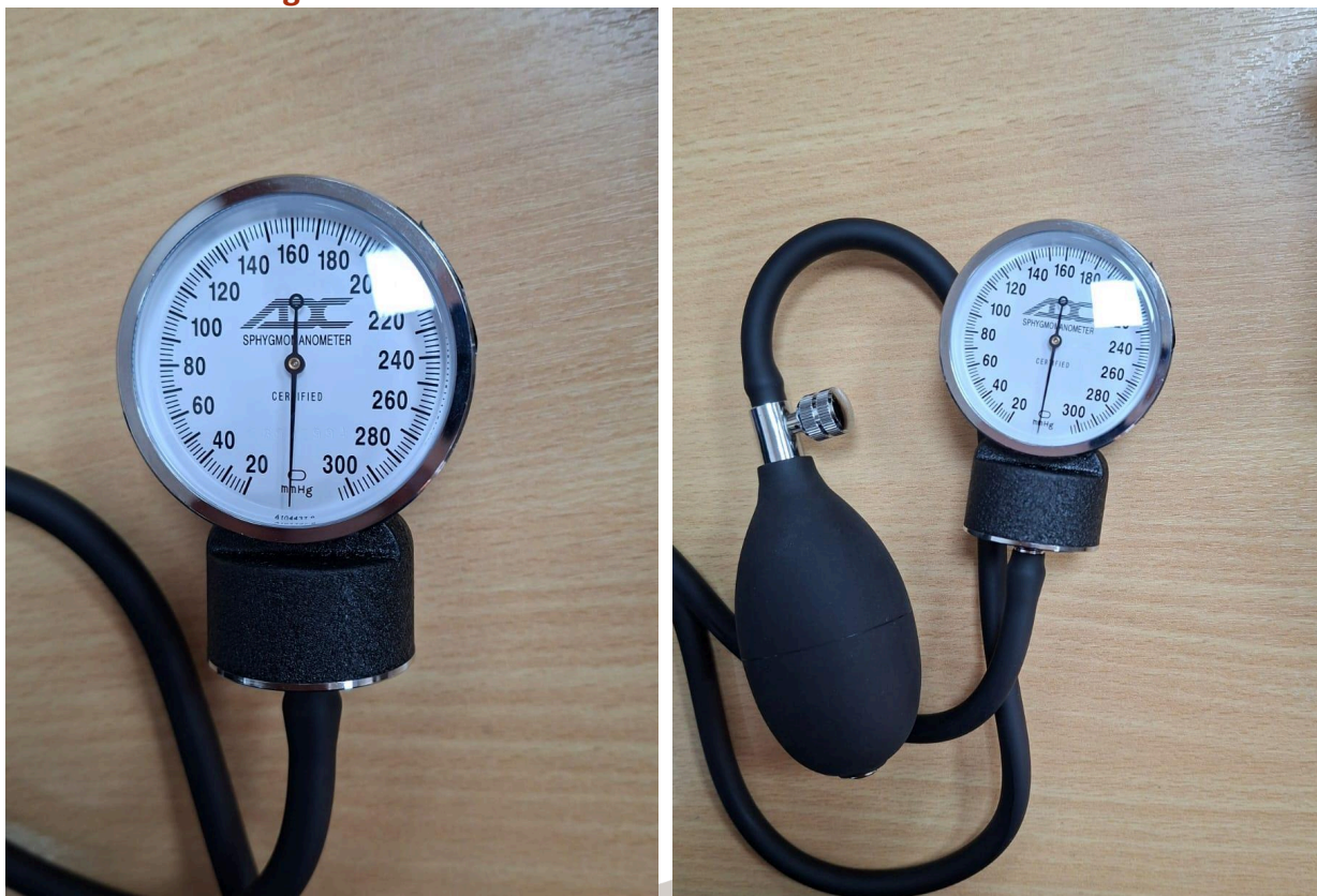
Figura 1. Vista General