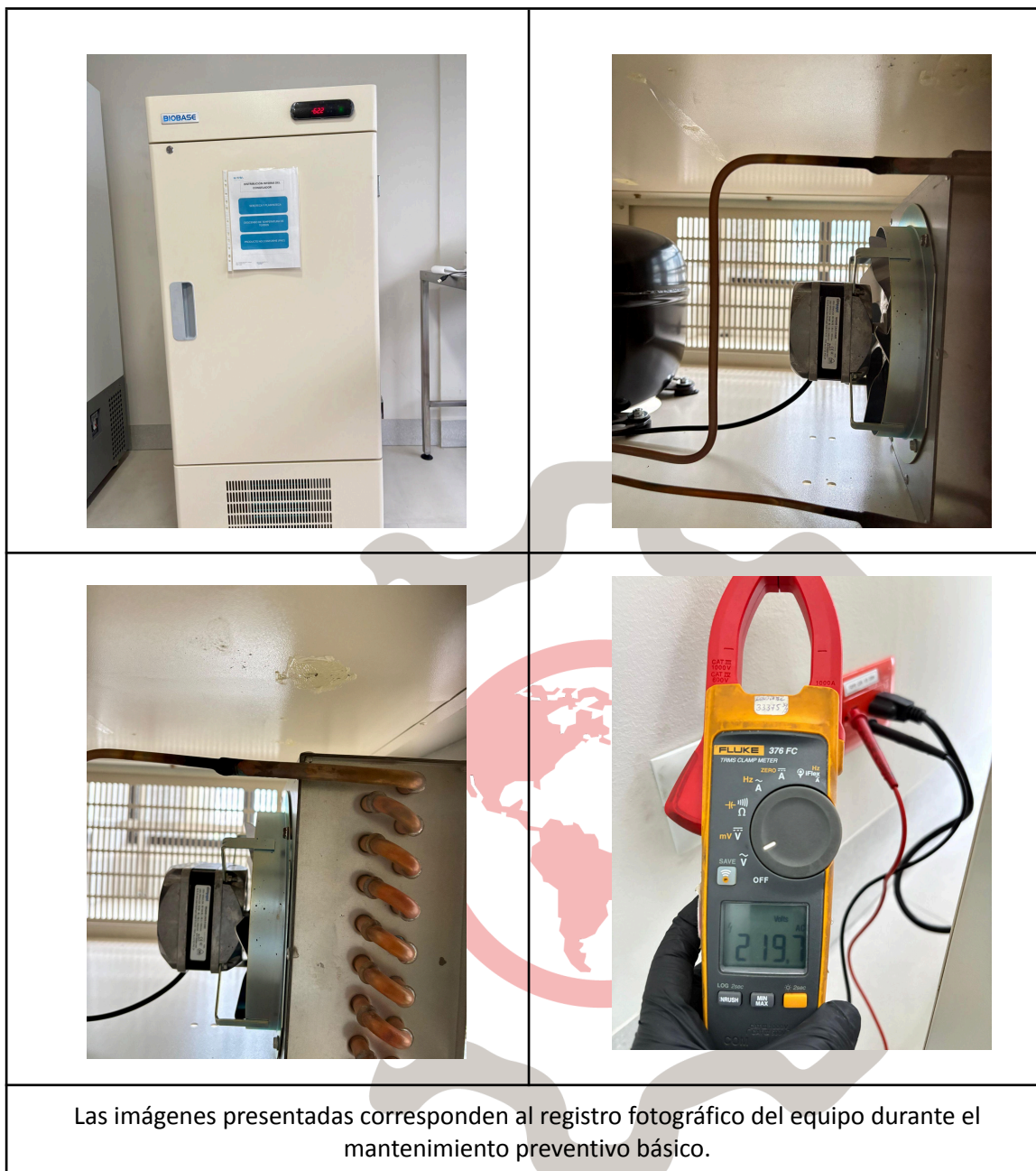
Las imágenes presentadas corresponden al registro fotográfico del equipo durante el mantenimiento preventivo básico.