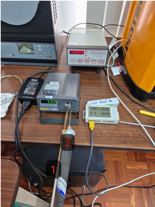
Diagram de Posición de Sensores (Sensor Position Diagram)