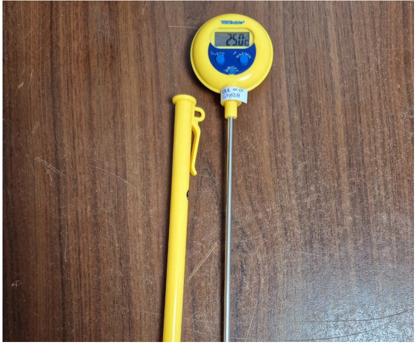
Figura 1. Vista frontal del equipo.