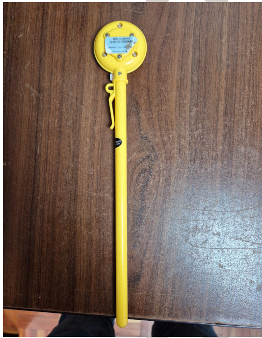
Figura 2. Vista Posterior del Equipo