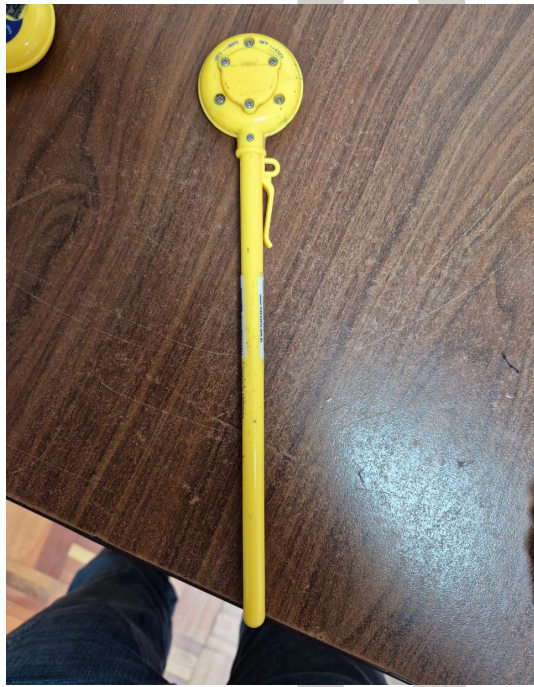
Figura 2. Vista Posterior del Equipo