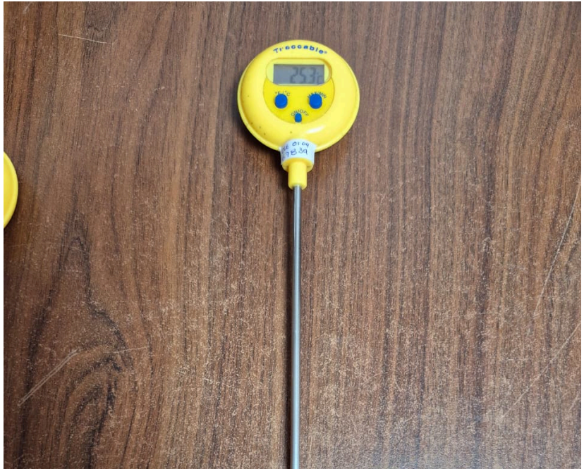
Figura 1. Vista frontal del equipo.