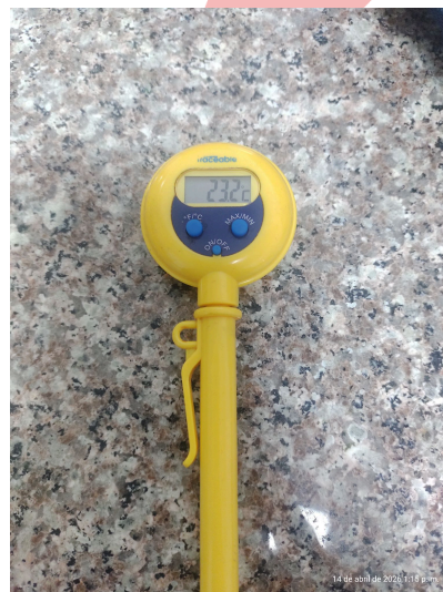
Figura 2. Vista Frontal del Equipo