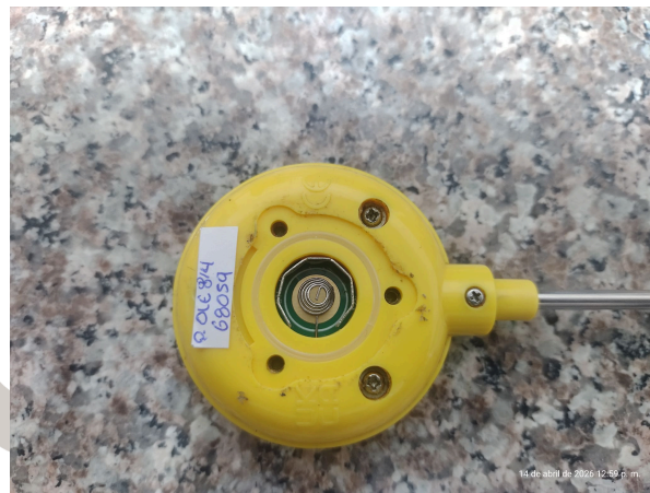
Figura 1. Vista posterior del equipo